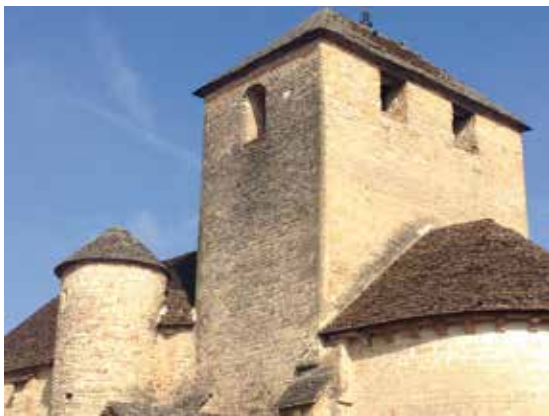
Le clocher Saint-Cyr-et-Sainte-Julitte de Bissy-la-Mâconnaise peut évoquer un donjon.

A Bissy-la-Mâconnaise , l'église Saint-Cyr-et-Sainte-Julitte du XII e siècle a été fondée par les moines de Cluny dans un style roman tardif. A l'intérieur, collection de statuettes d'art populaire datant de la fin du Moyen Âge au XVIII e siècle.