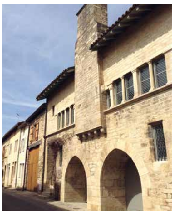
Maison romane à claires-voies, appelée aussi maison des fours banaux.

Les maisons romanes de Cluny sont très nombreuses. Elles forment le bourg monastique qui s'est étendu au-delà de l'enclos abbatial. Elles sont construites sur un modèle assez simple : rez-de-chaussée ouvert sur la rue par une ou deux arcades et réservé à l'usage professionnel, étage réservé au logement généralement formé de deux pièces éclairées par des claires-voies qui donnent à la façade clunisienne un caractère unique en France. Vous ne quitterez pas Cluny sans quelques coups d'œil aux églises paroissiales Saint-Marcel et Notre-Dame. Sachez encore que Cluny vous révélera d'autres splendeurs si vous aimez l'art classique et baroque (Hôtel-Dieu) ou le monde du cheval (haras).