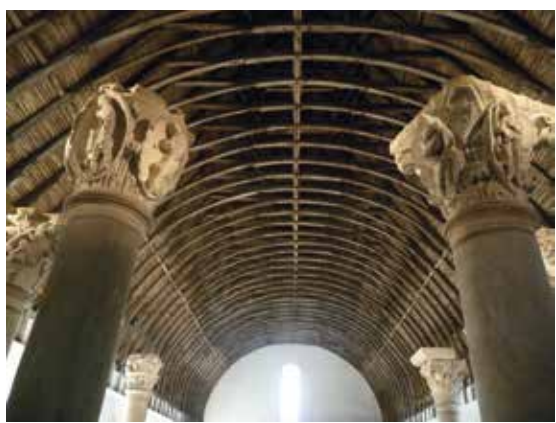
Dans le Farinier, vous pourrez admirer les chapiteaux du rond-point du chœur de l'église abbatiale.

La visite de Cluny se fera à l'aide de la publication de l'office de tourisme qui vous montrera l'importance de l'abbaye et du bourg monastique au Moyen Age en même temps qu'il vous permettra une interprétation du site. Fondée en 910 par le duc d'Aquitaine, pour le repos de son âme, l'abbaye de Cluny est directement placée sous l'autorité de Rome. Elle va vite devenir un symbole : celui du renouveau monastique en Occident avec près de 1400 dépendances dans toute l'Europe, d'autant que les abbés jouent le rôle de médiateur, entre les princes, rois et papes.