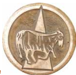
A Cluny, l'agneau sera votre guide pour la visite !

La D161 vous conduira à Martailly-lès-Brancion fermant ainsi la boucle. Sur la route, le château de Cruzille domine le village et la petite vallée. Des tours rondes, un escalier de pierres à volées droites ainsi qu'un portail en plein cintre ont été conservés. Propriété privée, vous pouvez seulement l'admirer !