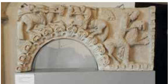
Linteau du XII e siècle représentant un combat de chevaliers.

Musée d'art et d'archéologie. Si le musée est installé dans le Palais Jean de Bourbon, logis seigneurial gothique, il présente cependant de très nombreuses pièces lapidaires romanes... Voyez notamment la reconstitution à l'échelle 1 d'une partie du grand portail de Cluny III, chef-d'œuvre de l'art roman.