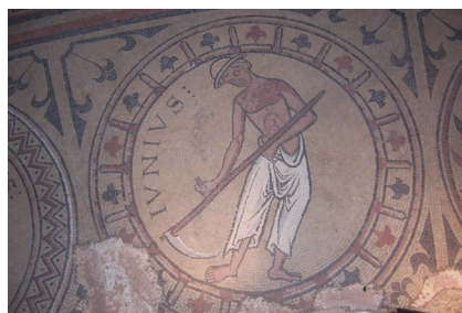
Le mois de juin

Suite à des travaux de restauration entrepris en 2002 dans l'église abbatiale Saint-Philibert de Tournus, les vestiges d'une mosaïque furent découverts et dégagés dans le déambulatoire du chœur, après une campagne archéologique de l'INRAP.