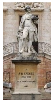
Statue de J.-B. Greuze par B. Rougelet

Le sculpteur choisi pour cette statue est un tournusien, né en 1834. Bénédict Rougelet, de son vrai prénom Benoît, apparaît vite à Tournus comme un enfant talentueux. Rapidement, il reçoit une bourse pour partir étudiant à Paris, puis à Lyon.